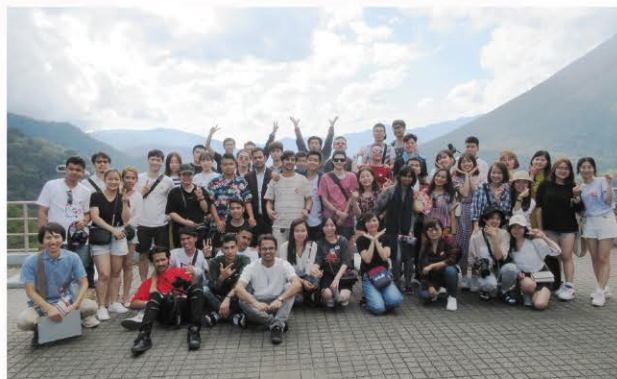
2019年度留学生旅行(日光)より